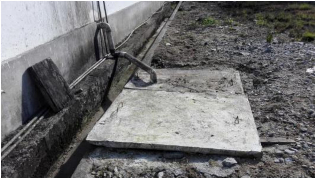
生活污水收集沉淀池

为调查工程在运行期对地表水水质的影响，特委托云南环绿环境检测技术有限公司于 2015 年 8 月 19 日-21 日对石竹河的水质进行了监测。监测断面包括了滚朋羊一级电站发电尾水口下游 100m（1#）、滚朋羊二级电站发电尾水口下游 100m（2#），共 2 处。其监测结果显示，以上 2 个断面所监测指标均达到 GB3838-2002《地表水环境质量标准》III类水质标准。因此，电站运行期地表水环境质量满足其功能要求。