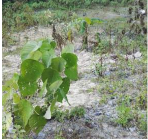
2#弃渣场（施工支洞口附近）