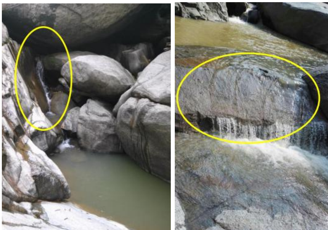
石竹河取水口 1240m 处的下开口

此外，在石竹河取水口 1240m 处留了 15cm×15cm 的口，约下放 0.1m 3 /s 的水量，而且在石竹河取水口下游 30cm 处的引水渠左侧开了个槽（高程约 1237m 处），使得水流漫出引水渠，减少了电站取水对其下游的减水影响。