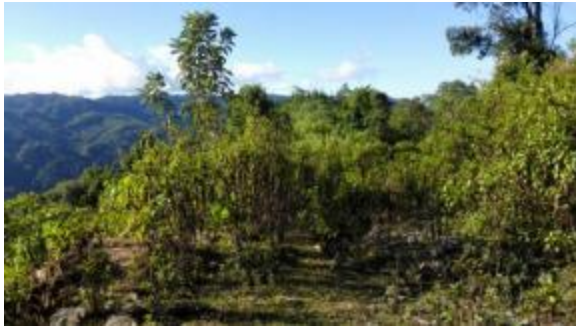
3#弃渣场（隧洞出口，压力前池附近）