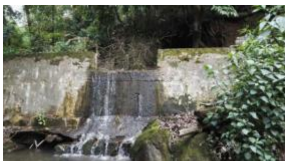
乌鸦卡河取水坝的溢流槽

根据调查，电站开工、发电至今，本电站涉及的厂坝区间的石竹河河段、乌鸦卡河取水坝下游均未发生断流现象。因此，本电站取水发电对取水坝下游河道影响不大。