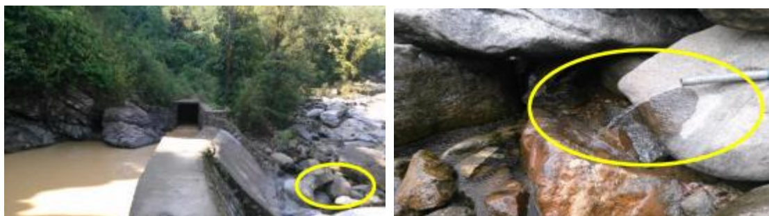
滚朋羊卡河取水坝底部约 1229.77m 处埋设的一根生态用水下放管，管径 50mm

但是本电站业主单位还是在滚朋羊卡河取水坝底部约1229.77m 处埋设了一根生态用水下放管，管径 50mm，其下放水量约 0.015m 3 /s；