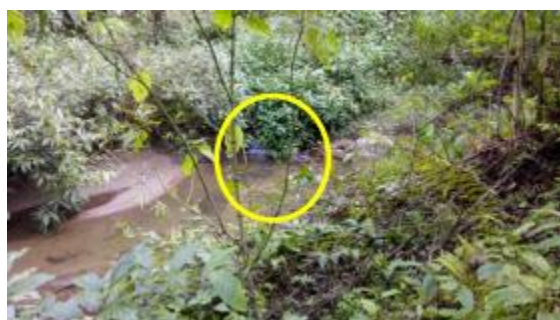
乌鸦卡河右岸约 20m 处有支流汇入