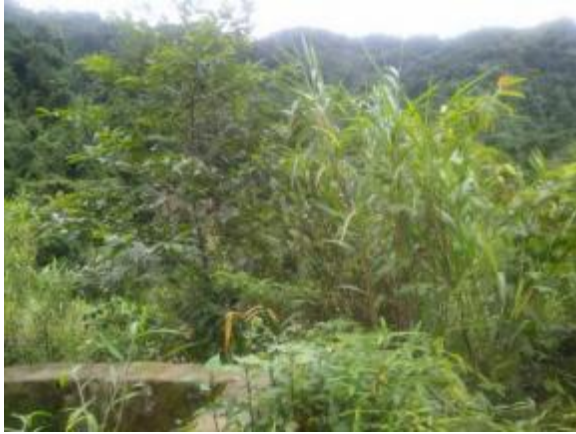
1#弃渣场（引水隧道进口）