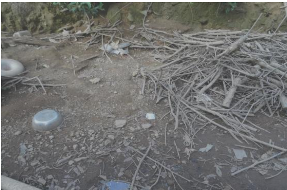
场区地埋式化粪池

由于电站生活污水产生量较少，验收监测期间电站无生活污水排放，故未能进行采样监测。