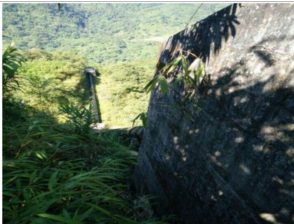
压力管道混凝土包管旁植被基本恢复