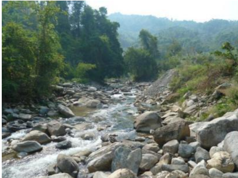
挖二生态放水（大坝下 100 米）