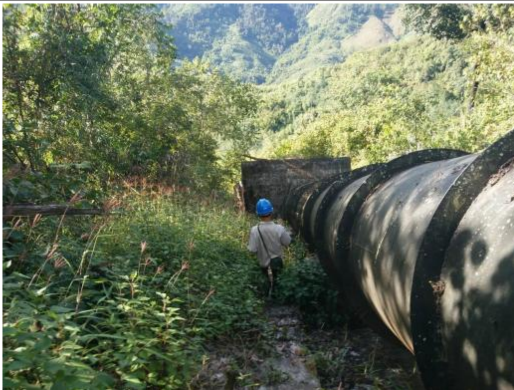
压力管道旁的植被基本恢复