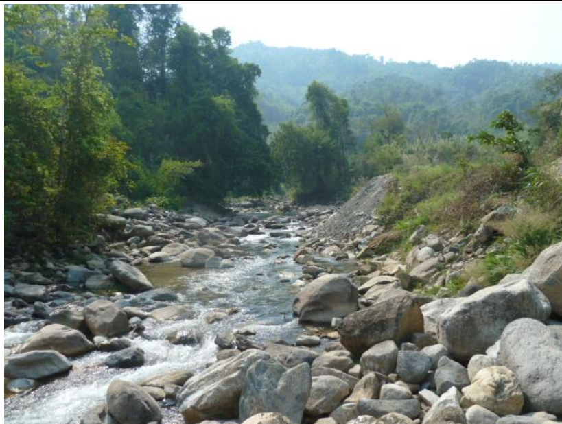
挖苦河拦河坝下生态放水（大坝下 100 米）