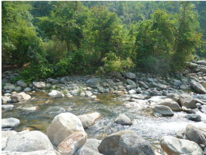
滩河拦河坝下生态放水