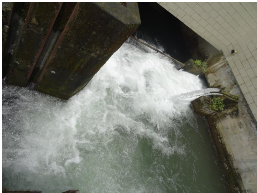
挖苦河二级水电站尾水

输水隧洞布置于大巴江左岸，由1条主隧洞及2段引水支洞组成，隧洞断面为城门洞形，主洞接挖苦河二级站尾水，沿途通过2条支洞引高河水、滩河入主洞。