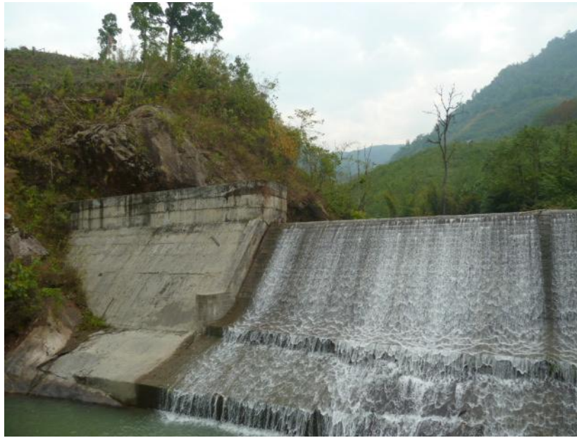
挖苦河拦河坝（挖苦河三级水电站）