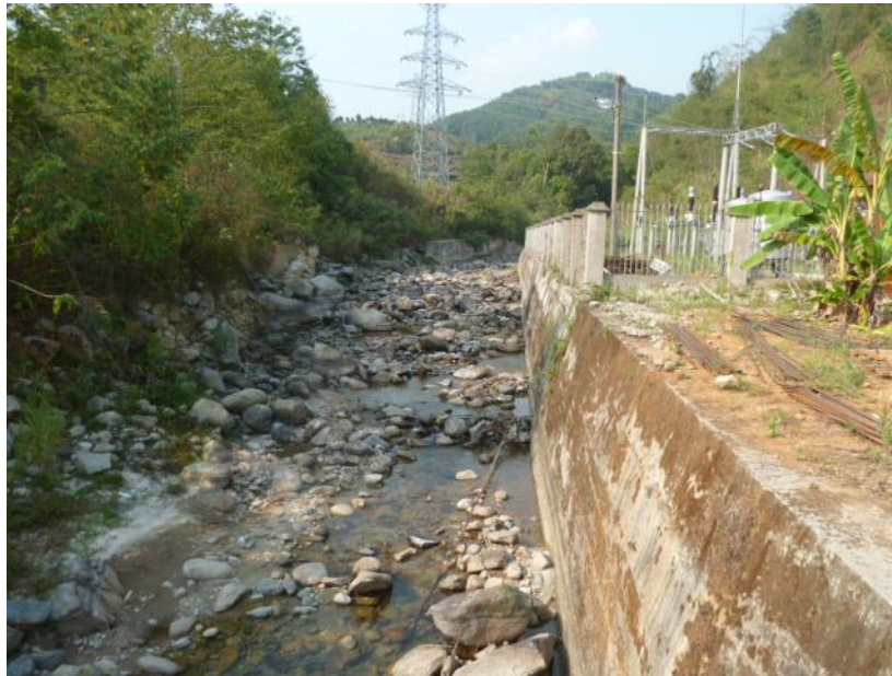
高河拦河坝下生态放水