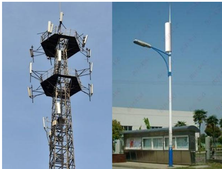
图 3 落地塔架设方式的基站