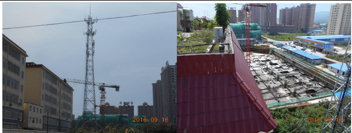
图 8-1 塔基处生态环境恢复情况