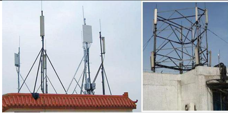
图 2 屋顶塔（抱杆与增高架抱杆）架设方式的基站