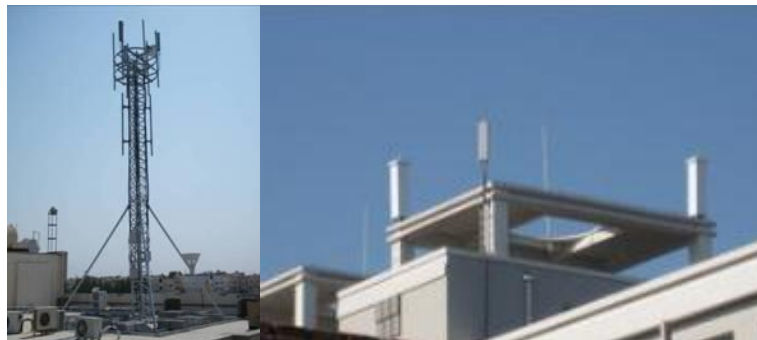
图 1 屋顶塔（四角塔与楼顶美化天线）架设方式的基站