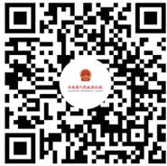
云南省人民政府公报 微信二维码