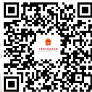
云南省人民政府公报 支付宝二维码