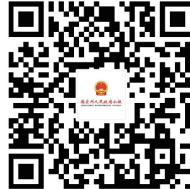
德宏州人民政府公报