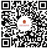
云南省人民政府公报 微信二维码