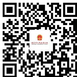
德宏州人民政府公报